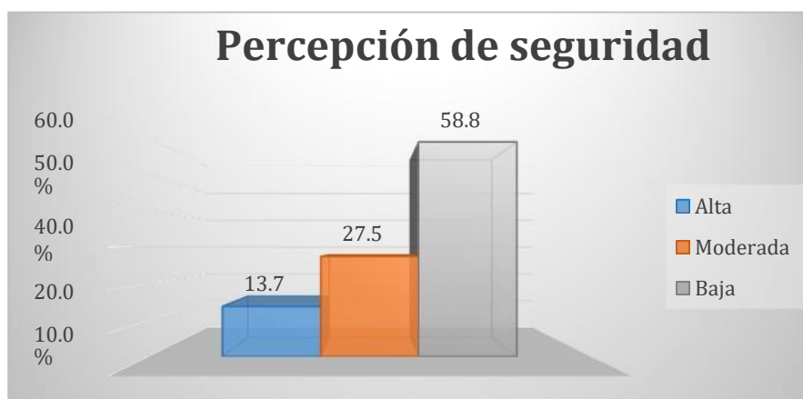
Figura 1: Percepción de la población sobre la seguridad ciudadana